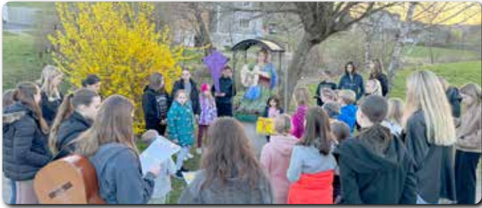
Station bei der Hl. Veronika beim Jungscharkreuzweg.