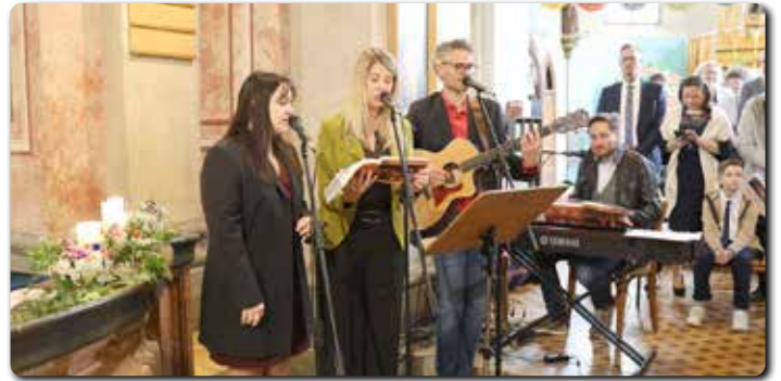
Die Kath. Jugend sang und musizierte für die Firmung.