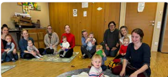
Treff der EKI Gruppe im 1. Stock im KPZ Heiligenkreuz.

Treffpunkt für Eltern mit ihren Kindern von 0-6 Jahren im KPZ (1. Stock). Die nächsten Termine: Mi 15.5., 29.5., 12.6. 26.6. 9-11 Uhr.