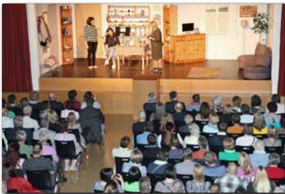
Großer Erfolg der Theaterrunde Heiligenkreuz!