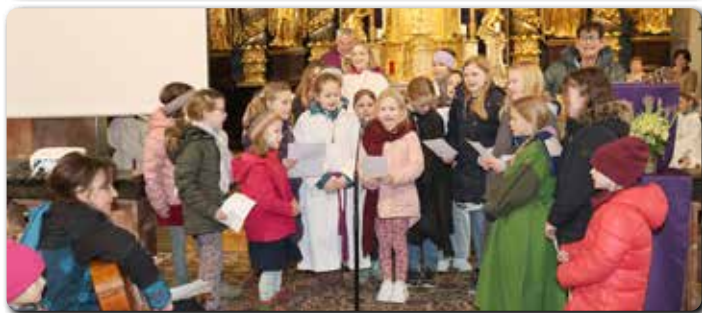
Evangeliumspiel und KiKiChor bei der Hl. Messe am 10.3.