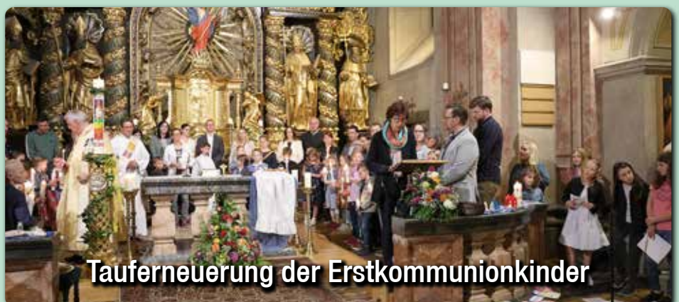
Tauferneuerung der Erstkommunionkinder