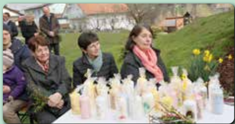
Gesegnete Osterkerzen wurden verkauft.

Aufgrund der Datenschutzgrundverordnung sind nur jene Jubilare veröffentlicht, wo die Pfarrblattredaktion eine Zusage für die Veröffentlichung erreichte.