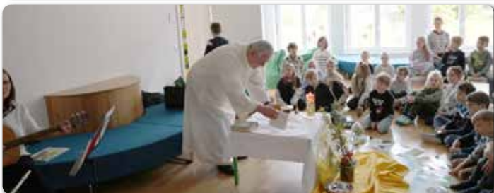
Ostergottesdienste der VS Heiligenkreuz, Empersdorf, Pirching.