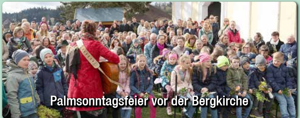
Palmsonntagsfeier vor der Bergkirche

So, 2.6. 9. Sonntag im Jahreskreis Pfarrmesse So, 9.6. 10. Sonntag im Jahreskreis , Vatertag Pfarrmesse So, 16.6. 11. Sonntag im Jahreskreis Pfarrmesse (10:30 Familienmesse in Allerh. )