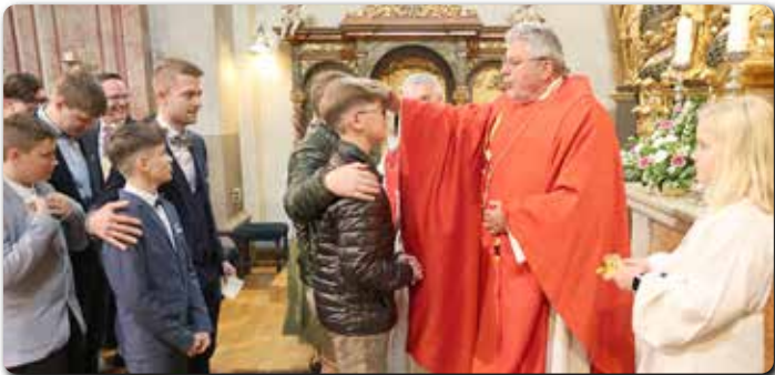
Spendung der Firmung durch Handauflegung und Salbung.