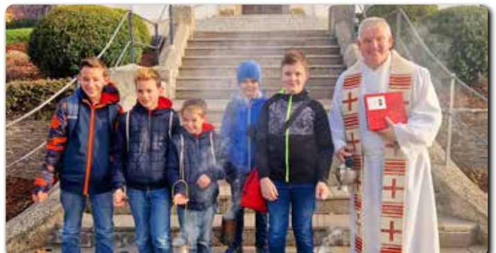
Weihfeuersegnung für die Weihfeuerträger am Karsamstag.