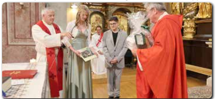
Dank an den Firmspender mit Geschenken aus der Pfarre.