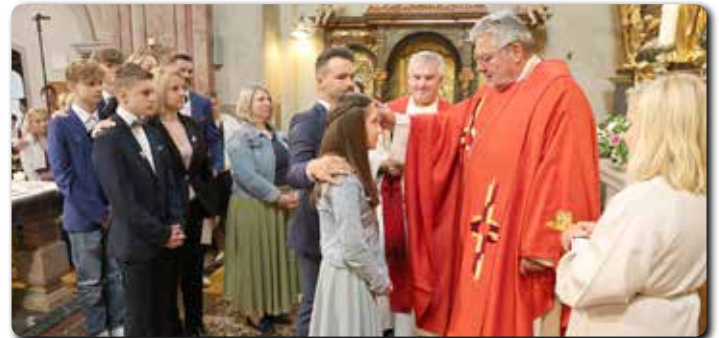
Der Firmspender dankte allen Firmbegleitern der acht Gruppen.