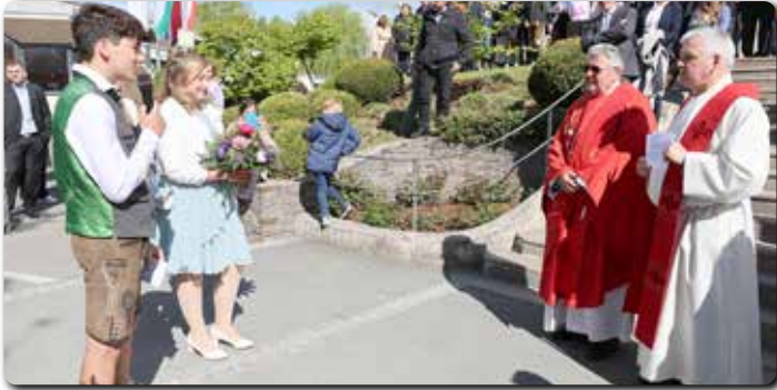
Begrüßung des Firmspenders vor der Pfarrkirche am 21. April.