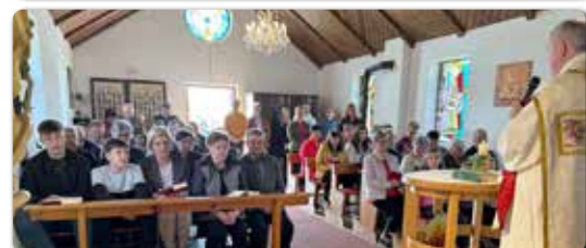
Die Karwoche feiern viele mit: Palmsonntag, Gründonnerstag, Karfreitag, Osternacht bis hin zum Ostermontag. Danke für alle Vorbereitungen!