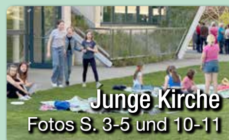
Junge Kirche Fotos S. 3-5 und 10-11