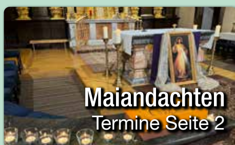
Maïandachten Termine Seite 2