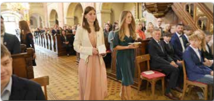
Die Firmlinge bringen auch Brot und Wein für die Hl. Messe.