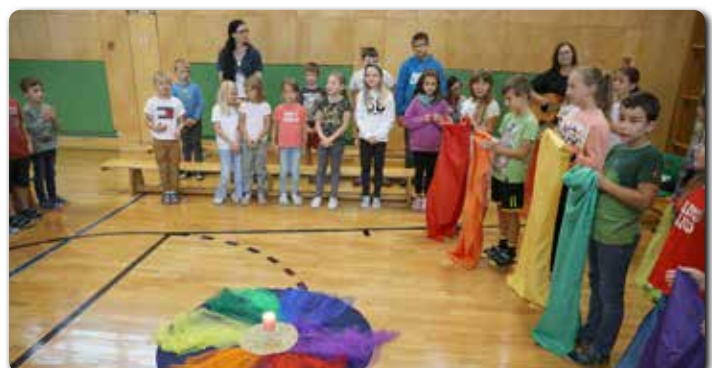
Das „Regenbogenlied“ gestalteten Schüler mit Tüchern mit.