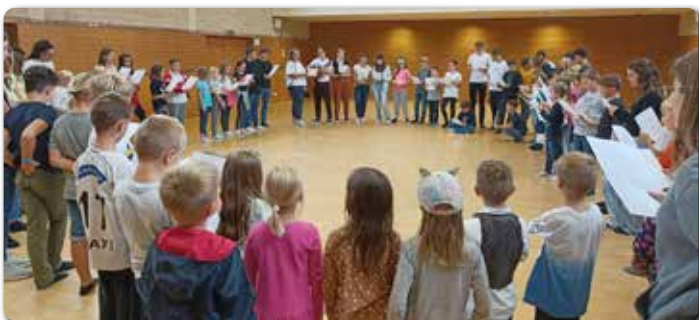
Oben und rechts: Startfest der Jungschar und Ministranten.