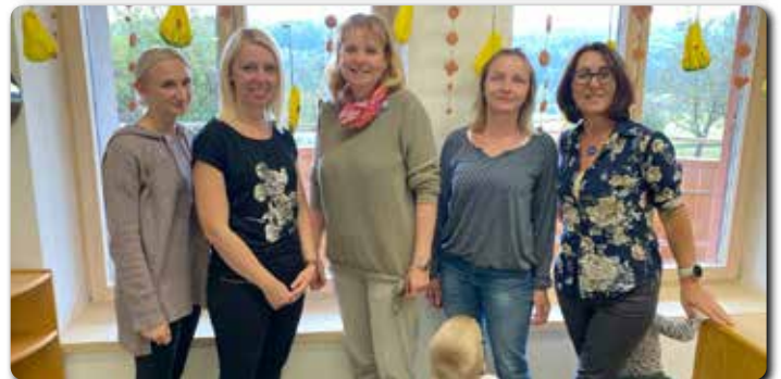
Das Team der Kinderkrippe in St. Ulrich am Waasen.

und der wiederkehrende Tagesablauf in der Gruppe geben den Kindern Sicherheit und Vertrauen. Beim täglichen gemeinsamen Spiel werden erste Kontakte geknüpft, aus denen dann Freundschaften werden können. So entsteht ein gemeinsames Miteinander. Die Kinderkrippe im Kinder nest wird ganztags bis 15.00 Uhr geführt.