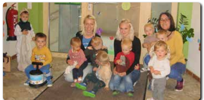
Die Kinderkrippengruppe im Kinder nest in St. Ulrich a. W.

Unsere Homepage: kiga-heiligenkreuz.graz-seckau.at