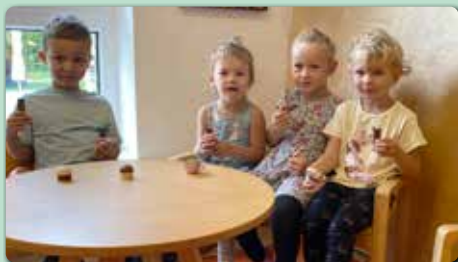
Kindergartenkinder in der Pause!

Aufgrund der Datenschutzgrundverordnung sind nur jene Jubilare veröffentlicht, wo die Pfarrblattredaktion eine Zusage für die Veröffentlichung erreichte.