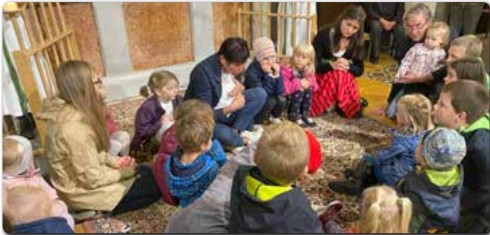
Gerne treffen sich die Kinder bei der Hl. Messe im Altarraum.