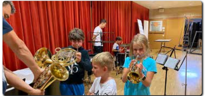
Kinder probierten beim Jungscharstartfest Musikinstrumente.