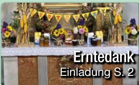
Erntedank Einladung S. 2