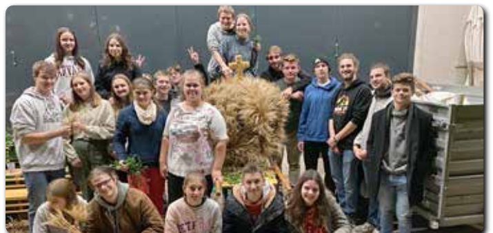
Danke der Kath. Jugend für die jährliche schöne Erntekrone!

Schön, dass DU dabei bist – Schön, dass IHR dabei seid!