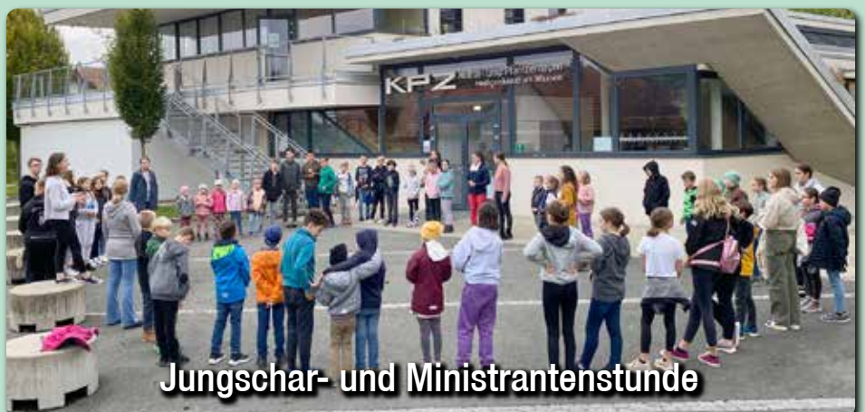
Jungschar- und Ministrantenstunde

Pfarrmesse (Möglichkeit zur Adventkranzsegnung)