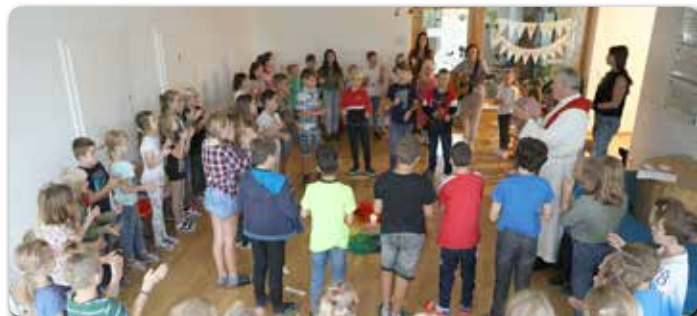
Schulgottesdienst der VS Pirching in der neuen Volksschule in Edelstauden, wo besonders die neuen Schüler begrüßt wurden.