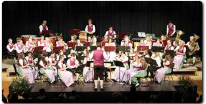
Die Marktmusik lädt wieder zum Konzert am 25. u. 27.11. ein!