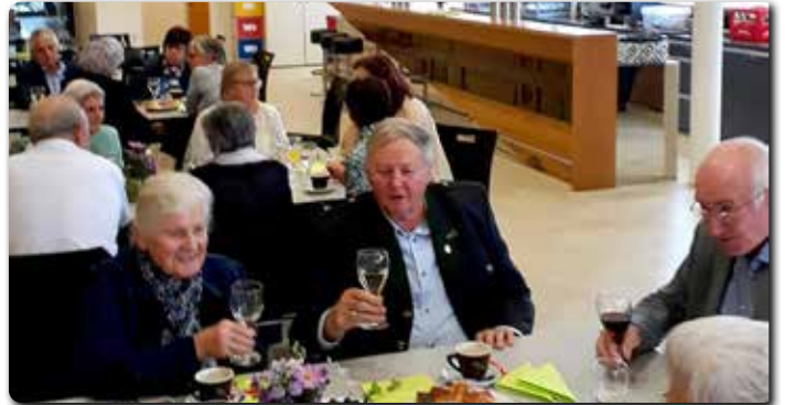
Beim Alten- und Krankensonntag am 18.9. wurde auch die Krankensalbung gespendet. Danach lud der Sozialkreis ins KPZ ein.