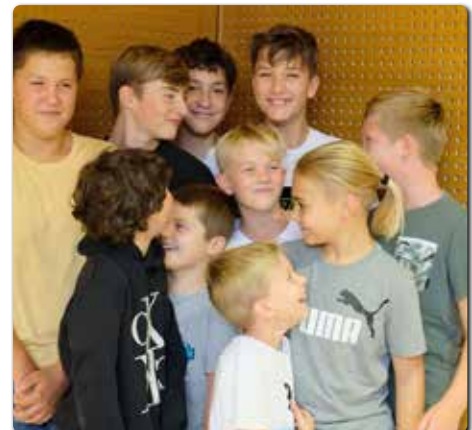
Beim Jungschar- und Ministrantenstartfest am 17.9. wurden Kürbisse geschnitten, und alle hatten viel Spaß an der Gemeinschaft.