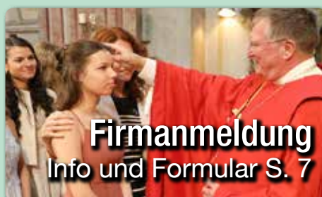
Firmanmeldung Info und Formular S. 7