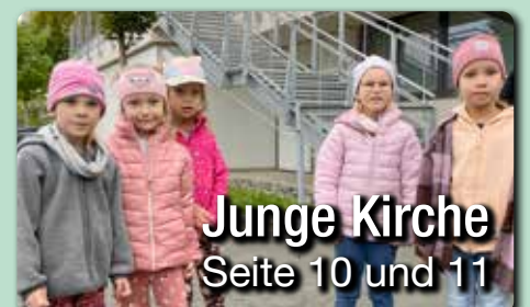
Junge Kirche Seite 10 und 11