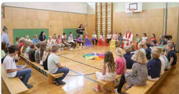
Schulanfangsgottesdienst der VS Empersdorf im Turnsaal.