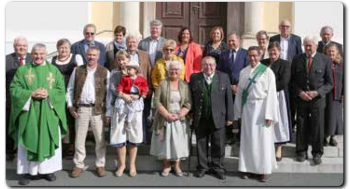
Am 18. September waren die Jubelpaare des heurigen Jahres zum Jubelpaargottesdienst und zur Agape im KPZ eingeladen.