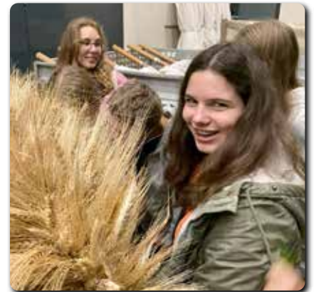
Jugendstartfest am 23.9. und Erntekronebinden der Kath. Jugend.